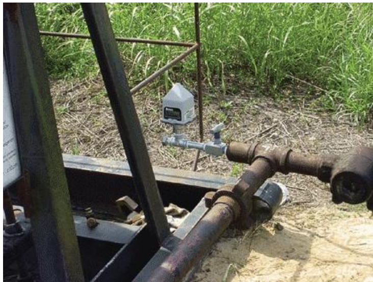
Figura 4: Sensor inalámbrico de presión para pozos de petróleo.