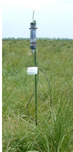
Figura 2: Sensor agrícola del proyecto LOFAR de lucha contra el hongo Fitóftora.

La agricultura constituye una de las áreas donde se prevé que pueda implantarse con mayor rapidez este tipo de tecnología. Por ejemplo, las redes de sensores favorecen una reducción en el consumo de agua y pesticidas, contribuyendo a la preservación del entorno. Adicionalmente, pueden alertar sobre la llegada de heladas, así como ayudar en el trabajo de las cosechadoras. Gracias a los desarrollos que se han producido en las redes de sensores inalámbricos en los últimos años, especialmente la miniaturización de los dispositivos, han surgido nuevas tendencias en el sector agrícola como la llamada agricultura de precisión. Esta disciplina cubre múltiples prácticas relativas a la gestión de cultivos y cosechas, árboles, flores y plantas, ganado, etc. Entre las aplicaciones más interesantes se encuentra el control de plagas y enfermedades. Por medio de sensores estratégicamente situados, se pueden monitorizar parámetros tales como el clima, la temperatura o la humedad de las hojas, con el fin de detectar rápidamente situaciones adversas y desencadenar los tratamientos apropiados. La gran ventaja del uso de esta tecnología es la detección a tiempo y la aplicación óptima de los pesticidas, únicamente en aquellas zonas donde resulta realmente necesario.